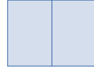
Aukeama 420 x 297 mm