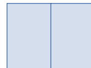
Aukeama 440 x 285 mm