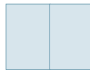
Aukeama 440 x 285 mm